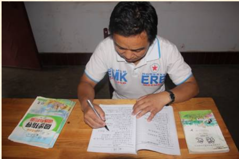
一丝不苟批改作业