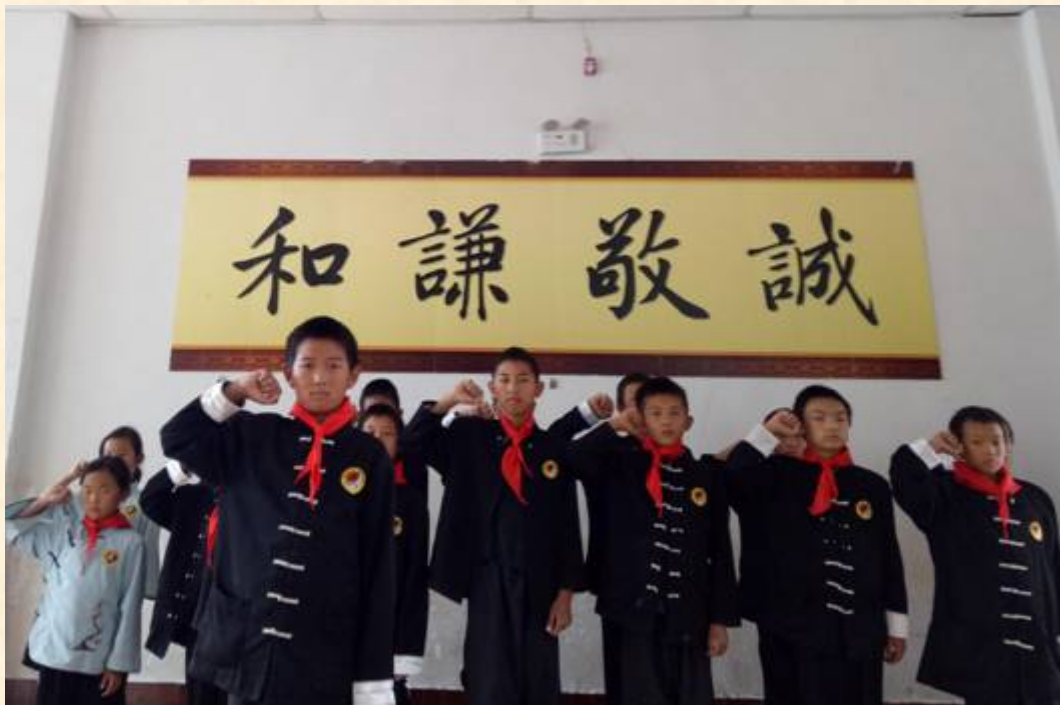
意气风发的少先队