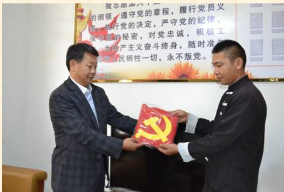
接受党旗、党徽、党章等赠送