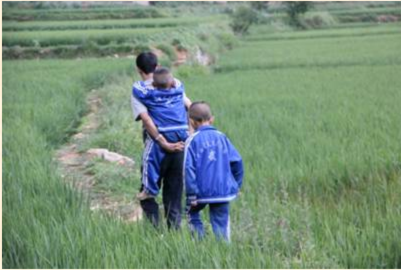
张老师在送孩子看病的路上