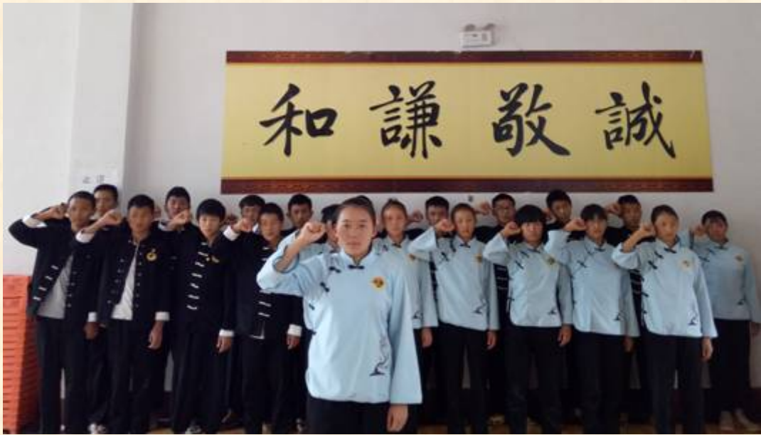
朝气蓬勃的共青团