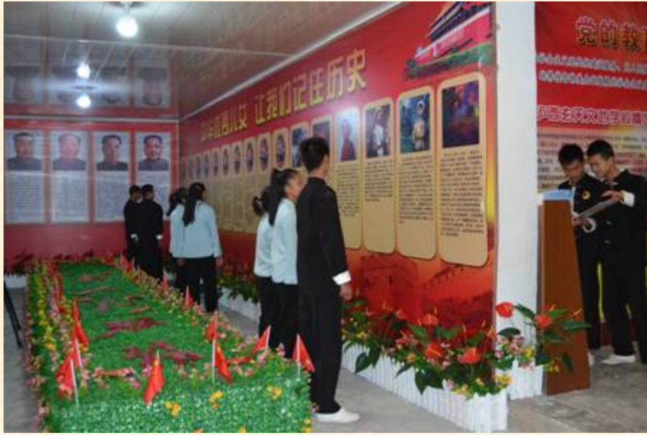
记住党的优秀儿女