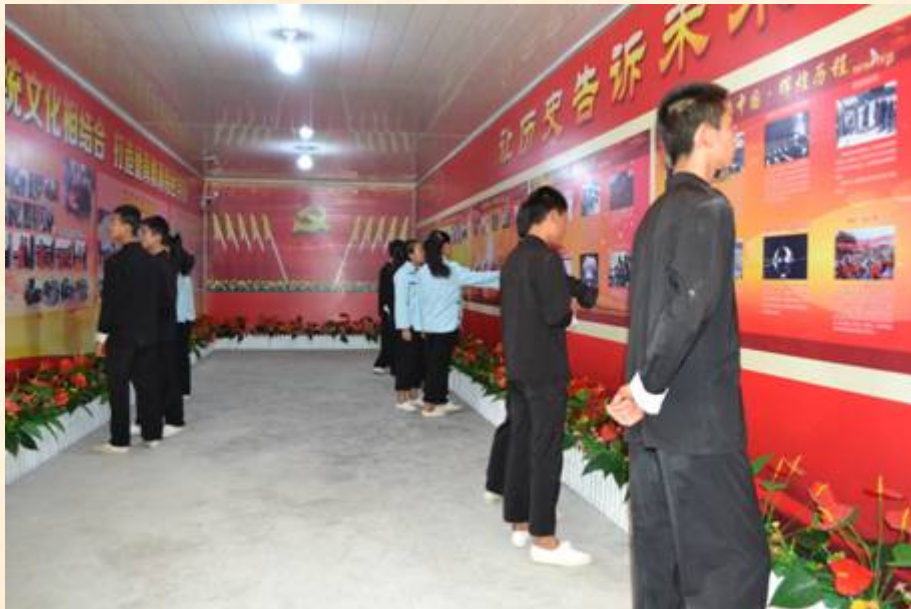
记住党的革命先烈